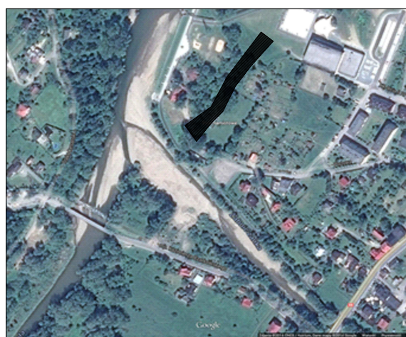
ORIENTACJA BEZ SKALI